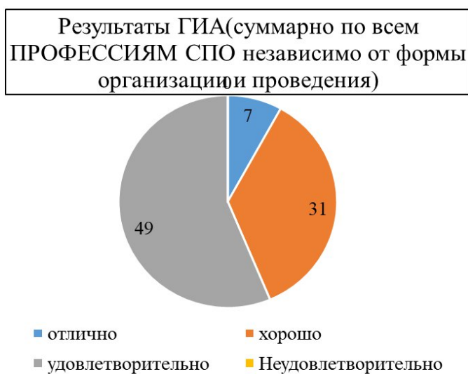
Рисунок 1 – Результаты ГИА по профессиям (% качества - 43,6)

Общие результаты государственной итоговой аттестации по профессиям и специальностям в 2025 году показаны на рисунках 1,2.