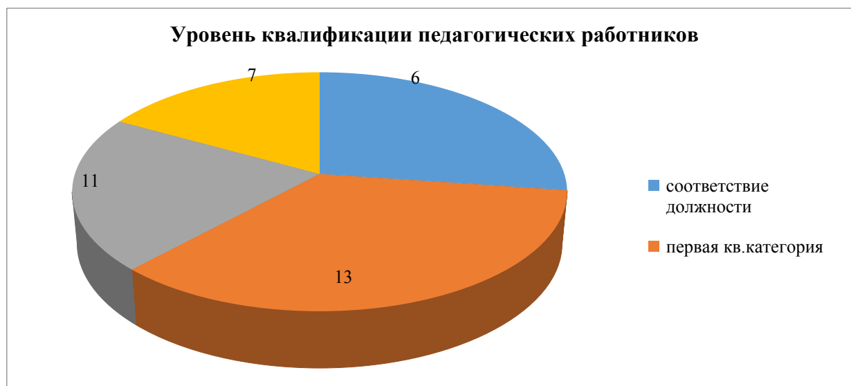
Рисунок 3- Уровень квалификации педагогических работников

Не аттестованы 7 педагогических работников колледжа. Это начинающие педагоги и внешние совместители, межаттестационный период которых составляет менее двух лет.