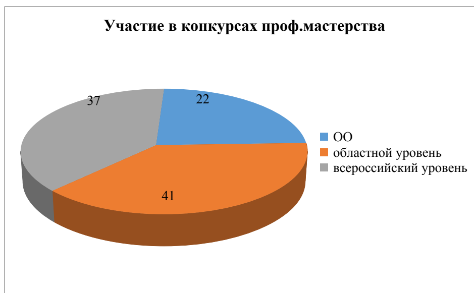
Рисунок 5 - Участие в конкурсах профессионального мастерства